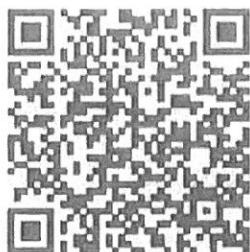
13. 髮型結構與成型-低層次-髮尾修飾與成型