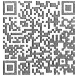
15. 髮型結構與成型-高層次-(左)側中線之後