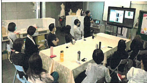
教師社群演講(創意與發明)