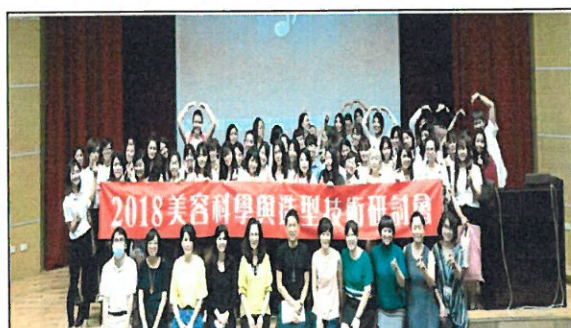
2018 美容科學與造型技術研討會