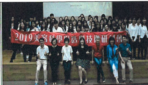
2019 美容科學與造型技術研討會