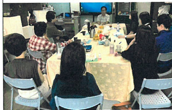
教師社群演講(質性研究探討)