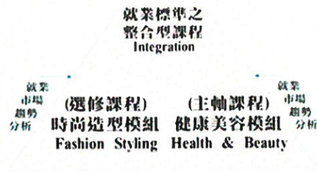
美容系核心能力課程之架構圖