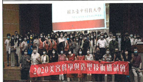
2020 美容科學與造型技術研討會