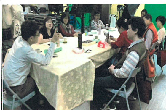
教師社群演講(撰寫論文與投稿技巧)